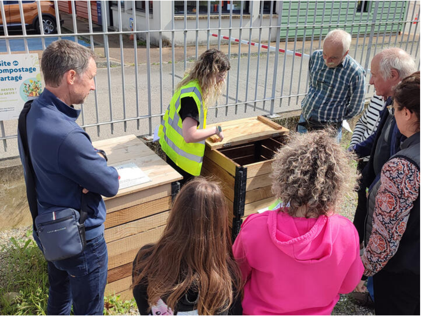
Atelier compost 38160 Saint-Sauveur Que faire de ses déchets alimentaires et autres déchets verts ? Le compostage, une alternative à la poubelle ! Tentez l'expérience... Plus d'infos sam. 19 sept.