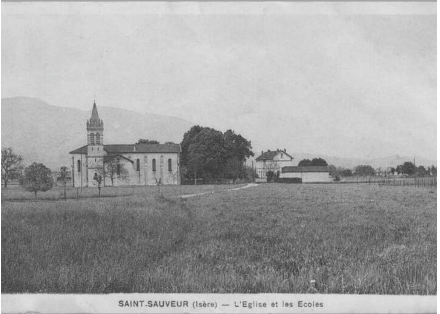
SAINT-SAUVEUR (Isère) — L'Eglise et les Ecoles

Conférence sur les églises de Saint-Sauveur