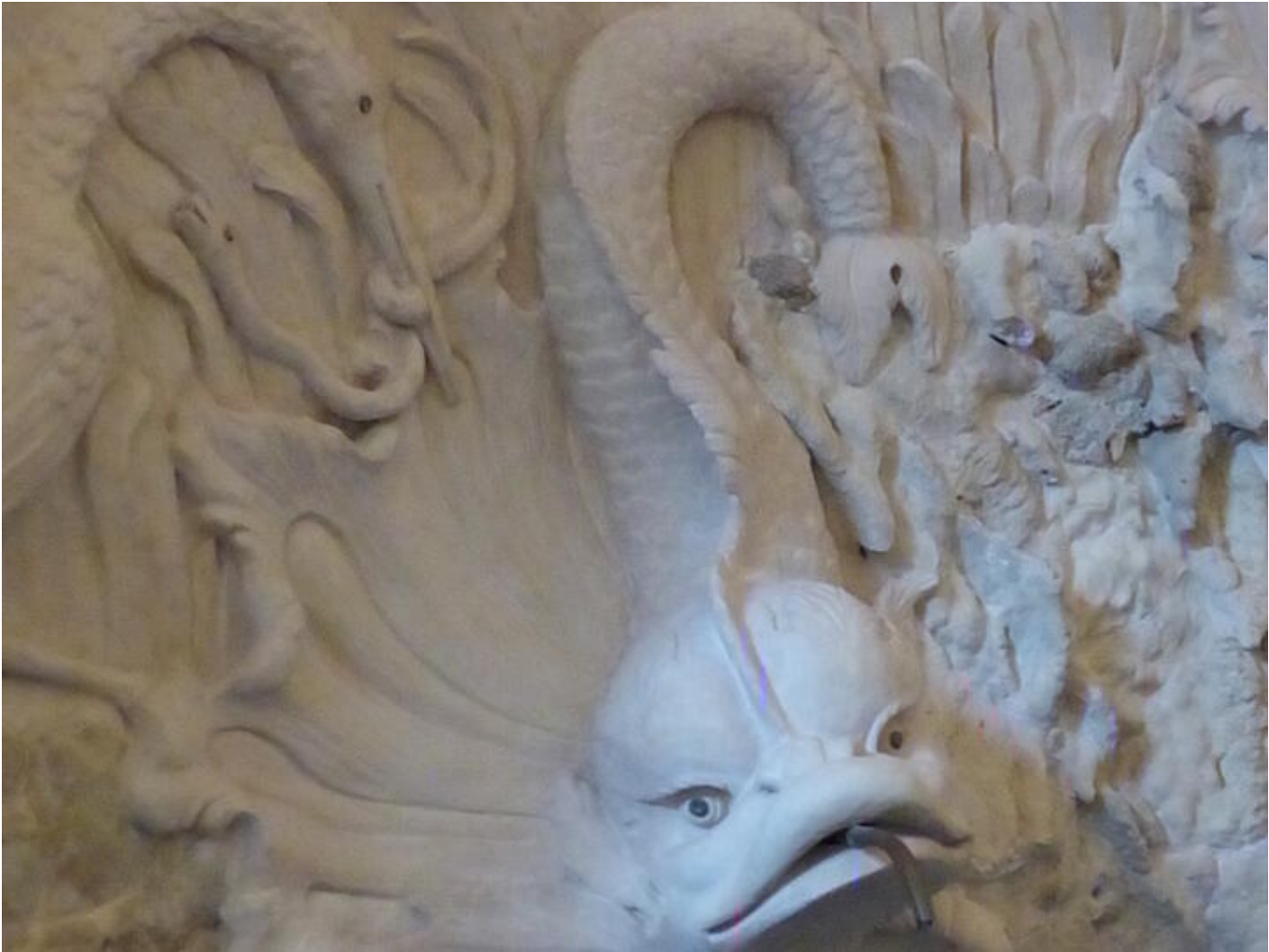
Visite guidée Saint-Antoine au fil du temps - Le temps du renouveau : art et collections 38160 Saint-Antoine-l'Abbaye

Visite permettant de découvrir des espaces qui ne sont pas ouverts au public.